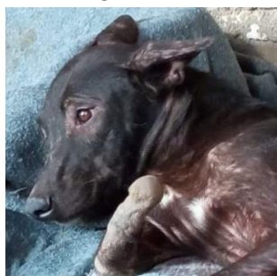
Egypte : QAMAR-MOON