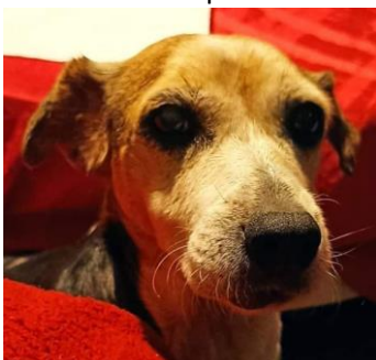
SWEETY, 12 ans en FALD à La Réunion