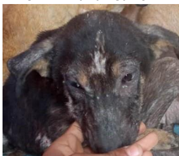
Egypte : STAR