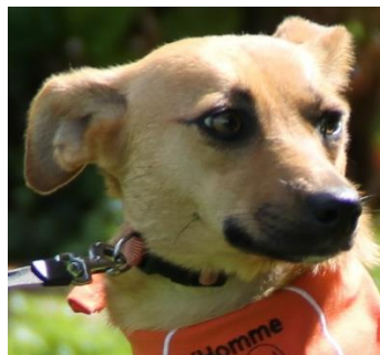
KIRA, 17 mois à l'adoption