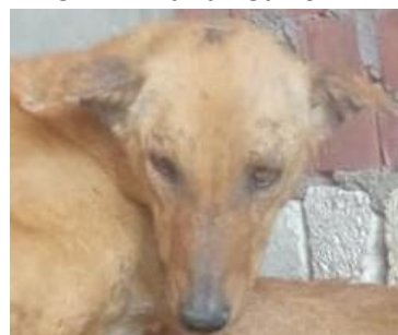
Egypte : HAPPY