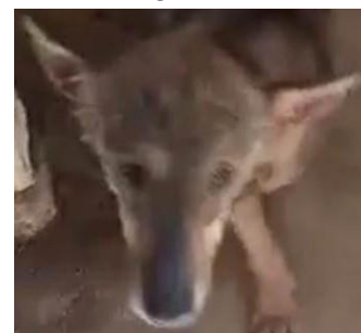
Egypte : BEAUTIFUL

Le parrainage cherche à couvrir la nourriture (parfois spécialisée), les frais vétérinaires, une participation aux frais d'accueil éventuels (de pension parfois, car nous manquons de Familles d'Accueil !) ou encore de voyage du Loulou concerné. Le montant du parrainage est libre, par principe, mais, en général, le parrain ou la marraine met en place un virement mensuel sur le compte de l'Association. Chaque animal peut avoir plusieurs parrains et marraines.