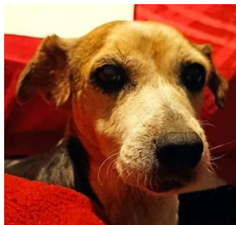
SWEETY, 11 ans en FALD à La Réunion