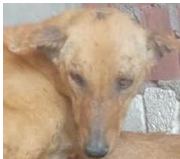
Egypte : HAPPY