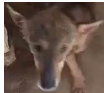
Egypte : BEAUTIFUL

Le parrainage cherche à couvrir la nourriture (parfois spécialisée), les frais vétérinaires, une participation aux frais d'accueil éventuels (de pension parfois, car nous manquons de Familles d'Accueil !) ou encore de voyage du Loulou concerné. Le montant du parrainage est libre, par principe, mais, en général, le parrain ou la marraine met en place un virement mensuel sur le compte de l'Association. Chaque animal peut avoir plusieurs parrains et marraines.