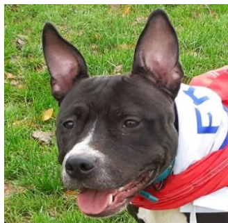
ALMA, 6 ans à l'adoption