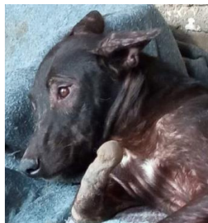
Egypte : QAMAR-MOON