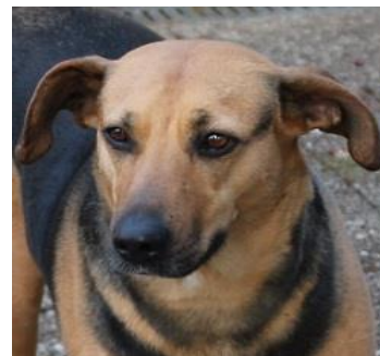
GAÏA, 7 ans en FALD