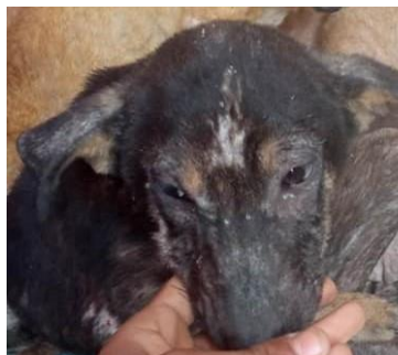
Egypte : STAR