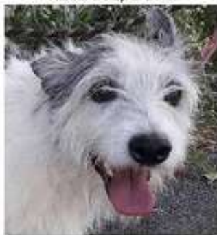
PERLE, 8 ans