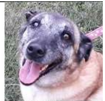
ROMANCE, 13 ans