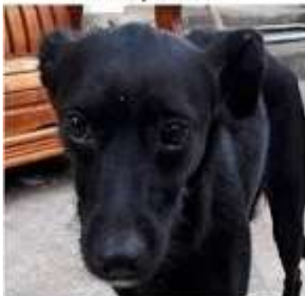
ROXANE, 2 ans