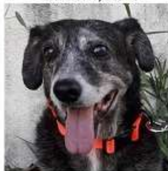
PAPINOÙ, 14 ans