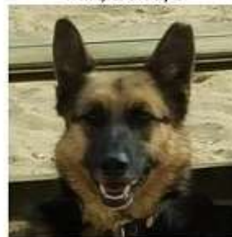
TEXAS, 9 ans