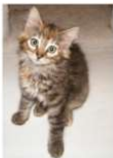
PACHA (M), semi-angora