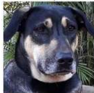
MIA, 1 an 1/2