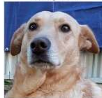
DOUGHY, 5 ans