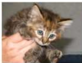
PISTACHE (F), semi-angora